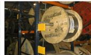
ESTANTERIA DE ROLLOS