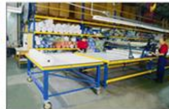
MESAS DE CORTE