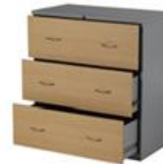
ARCH IVADOR 3 GAVETAS HORIZONTAL