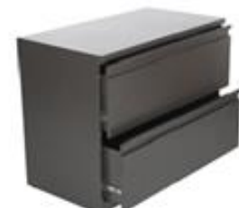
ARCHIVADOR 2 GAVETAS HORIZONTAL