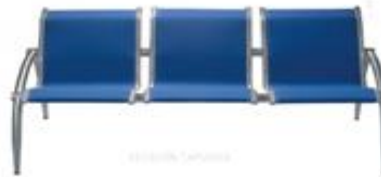
ESTACION TAPIZADO ACERO INOXIDABLE