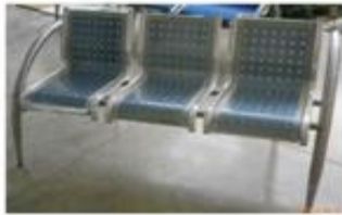
ESTACION ACERO INOXIDABLE