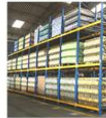
ESTANTERIA DE FLUJO